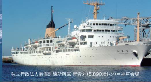
独立行政法人航海訓練所所属 青雲丸(5,890総トン)＝神戸会場