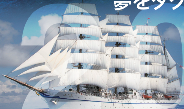
航海訓練所 帆船日本丸