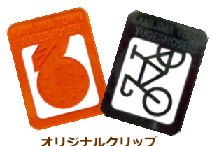
オリジナルクリップ