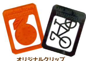
オリジナルクリップ