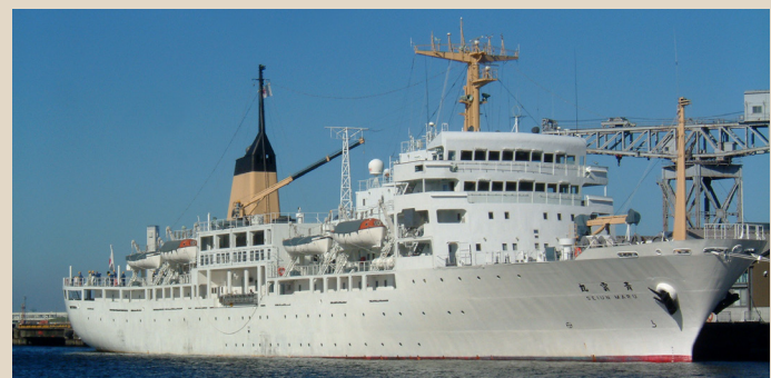
独立行政法人航海訓練所所属 青雲丸(5,890総トン)＝神戸会場

貿易立国、技術立国の日本を支え、広く世界へ、未来へと羽ばたく国際性豊かなたくましい若者を育てています。商船学科のある国立高等専門学校は、全国に5校「富山(富山県)、鳥羽(三重県)、広島(広島県)、大島(山口県)、弓削(愛媛県)」あります。5年半にわたる一貫した教育システムにより高い水準の専門知識を身につけることができ、卒業時には準学士の称号が与えられます。外航海運会社などの一流企業をはじめ官公庁等からの求人も多く、また、三級の海技免状を必要とする国内の長距離フェリー会社でも活躍することができます。なお、卒業後に大学の3年次に進学することもできます。