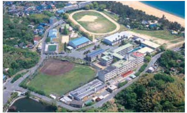
校舎地区全景 [Areal View of the School]