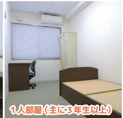
1人部屋(主に3年生以上)

各部屋には、机、イス、サイドワゴン、本棚、ワードローブ(カバー付きハンガーラック)、ベッド、長押、エアコンがあります。