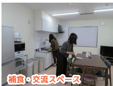
補食・交流スペース