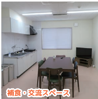
補食・交流スペース

各部屋には、机、イス、サイドワゴン、本棚、ワードローブ(カバー付きハンガーラック)、ベッド、長押、エアコンがあります。