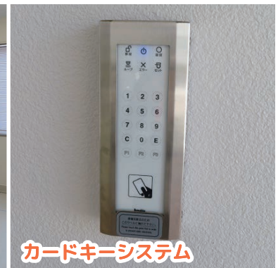
カードキーシステム