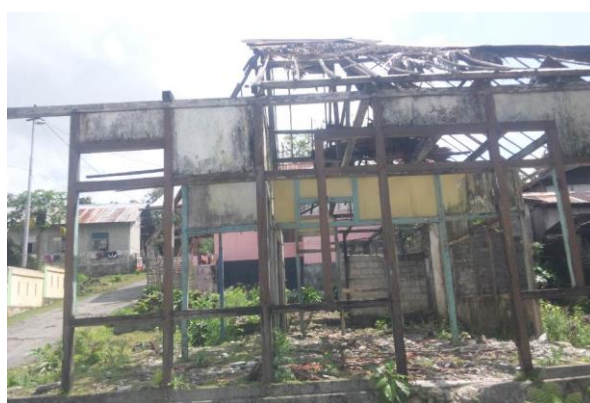
写真2. 無残な焼け跡

ところで、前出の2012年2月29日のアンボン地域代表協議会(DPD)議長発言は、ポルト村ハリア村と同時にプラウ村についても慣習の弱体化による紛争との見方を示しているが、 (33) 同村の場合まさに慣習儀礼を巡って紛争が発生しており、それゆえ伝統慣習の強化が、必ずしも紛争防止につながらない場合もあることは明らかである。