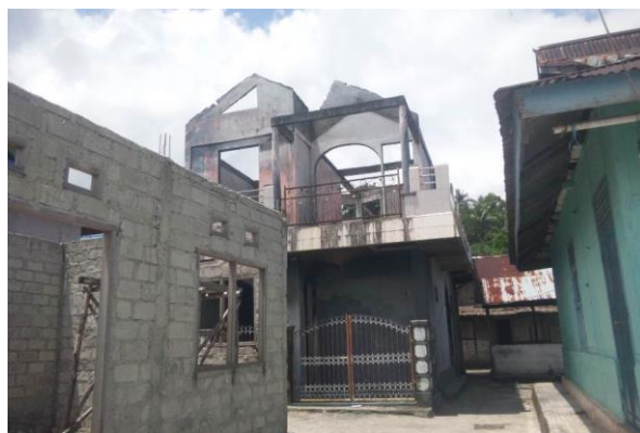
写真1. 住民はアンボンに避難中。

問題が解決したといえる状況ではない。筆者が訪問した2014年9月10日時点でも、多くの避難者が帰村しておらず、 (32) 再建されず廃墟のまま更地のまま、という住宅が多数見られた。(写真参照)