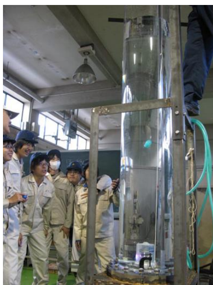
図2 実習用に製作した高さ2mの円柱水槽

まず学生各自に、おゆまるという、お湯で軟らかくなり冷えると固まる特殊な粘土を使い自由な形状の浮力体を製作させる。製作した浮力体それぞれに対し浮上実験を行い、水槽の底から水槽上面に到達するまでの時間を計り、形状によってどのような軌道やスピードで浮上するのかを確認する。浮上実験には、本実習用に開発した発射台を使用した。この発射台は電磁石を用いており、製作した浮力体の底に鉄製のボルトを埋め込み、発射台に吸着して、そのまま水槽上面から水槽の底まで沈め、水槽外部から遠隔操作で電磁石をOFFして発射させる機構となっている。