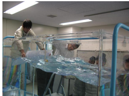
図1 波を作っている様子

まず、図1に示すように横幅2m、奥行き2m、深さ1mの大型アクリル水槽の中に塩ビパイプで波を作り、周期、周波数、共振周波数等、波の特徴について説明する。次に塩ビパイプを波にそって上下させ、共振により大きな波を作る。学生は自分自身で波を作ることに加え、波が大きくなって行く様子を外から観察できるので、共振についての理解を深めることができる。