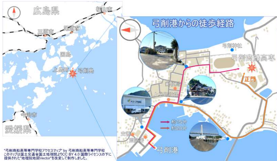
◆ 弓削商船高等専門学校アクセスマップ

*弓削商船高等専門学校アクセスマップ by 弓削商船高等専門学校 このマップは国土交通省国土地理院よりCC BY 4.0 国際ライセンスの下に 提供された"地理院地図Vector"を改変して制作しました。