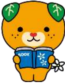
愛媛県イメージアップキャラクター みきゃん