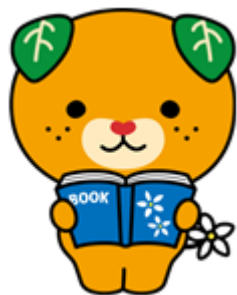
愛媛県イメージアップキャラクター みきちゃん