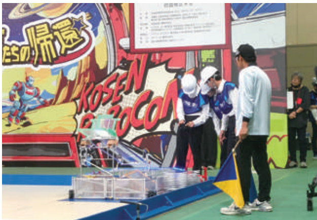
ロボット研究部(ロボットコンテスト)[Robot-Research Club(Robot Contest)]

All Shikoku KOSEN Robot Contest, All Shikoku Kosen Cultural Festival