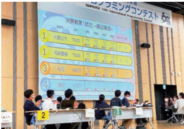
マイコン部(プログラミングコンテスト) [Micro computer Club(Programming Contest)]