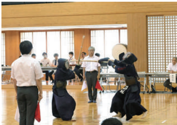
剣道部 [Kendô Club]