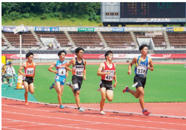
陸上競技部 [Track and Field Club]

Shikoku regional college of technology athletic meet, All-Japan senior high school baseball championship tournament in Ehime, Setouchi two-school routine match, Interscholastic athletic meet in Ehime, Cutter race of three colleges of Maritime Technology