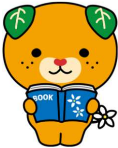
愛媛県イメージアップキャラクター みきゃん